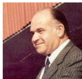
on. Valerio Zanone Fondazione Einaudi Roma