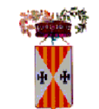
Provincia di Catanzaro